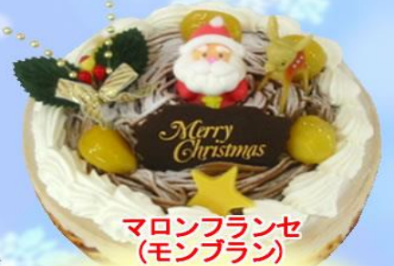
マロンフランセ (モンブラン)