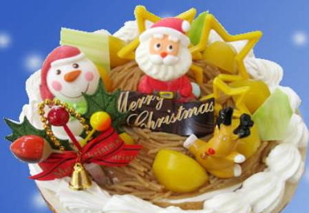
マロンフランセ(モンブラン)