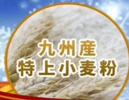
九州産 特上小麦粉