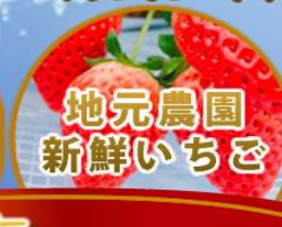
地元農園 新鮮いちご